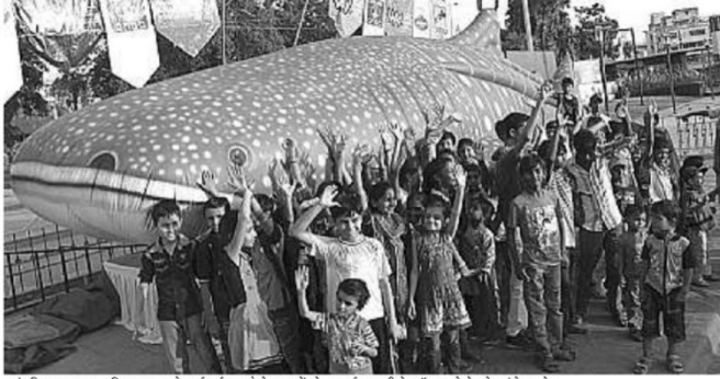
કાંકરિયા તાલાવ પર રવિવાર શામ કો લાઈ ગઈ ગુબારે કે રૂપ મેં વ્હેલ-શાર્ક મછલી કે મોડલ કો દેખને પહુંચે વન્ને।